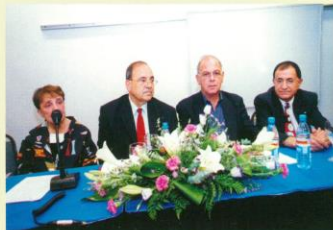
מימין ישראל אייזקס דל, יוד הפורום הכלכלי