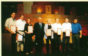
מקבלי האוחות עם ראש המחשלה אריאל שרון כנס 2001