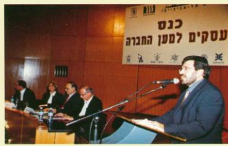
כנס עסקים למען החברה בת"א