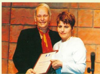
דליה איציק שרת התעשייה דאד, ונציגת מייקל שטיינהרט